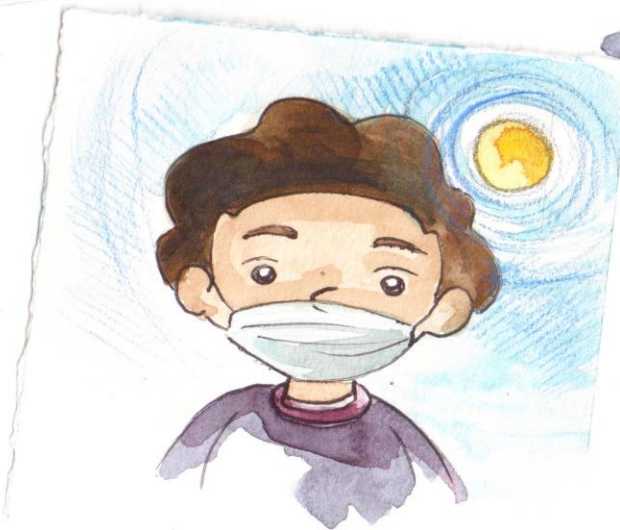
STO ALL'ARIA APERTA