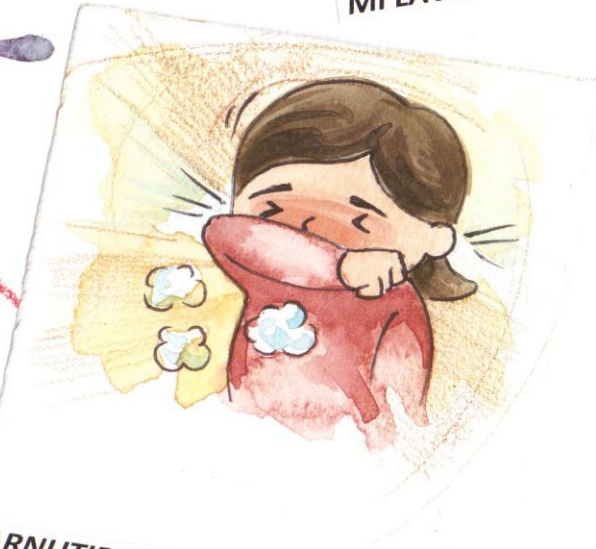
PER STARNUTIRE O TOSSIRE USO LA PARTE INTERNA DEL GOMITO