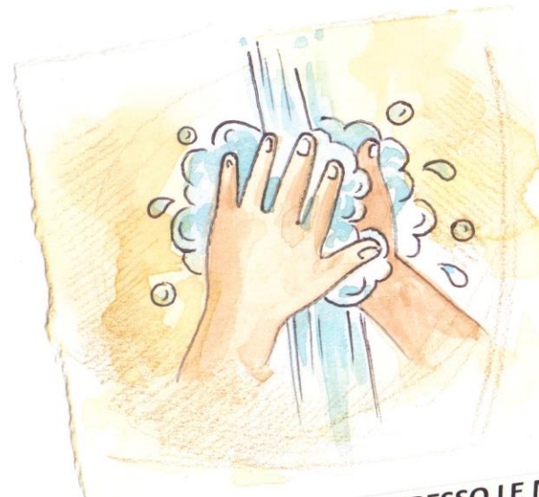
MI LAVO SPESSO LE MANI