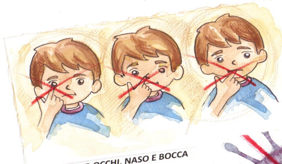
NON MI TOCCO OCCHI, NASO E BOCCA